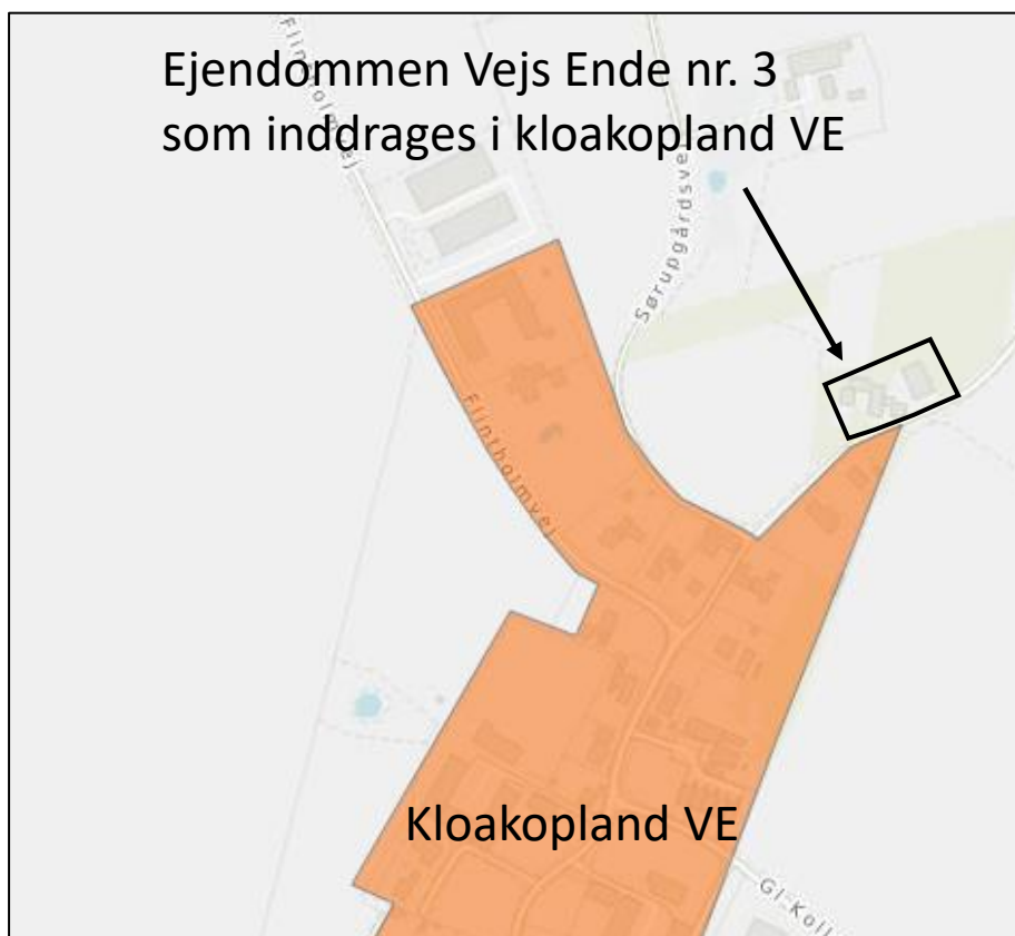
Figur 1 Afgrænsning af nyt kloakopland der inddrages i kloakopland VE

Ejendommen Vejs Ende 3 inddrages i kloakopland VE. Det afgrænsede kloakopland udgør kun den bebyggede del af ejendommen Matr.nr. 5i Kollerød by, Lyngø.