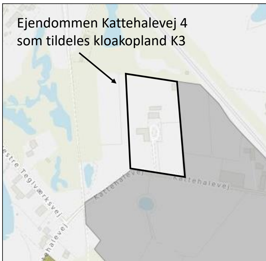
Figur 2 Afgrænsning af nyt kloakopland K3

Ejendommen Kattehalevej 4 tildeles betegnelsen kloakopland K3. Det afgrænsede kloakopland udgør kun den bebyggede del af ejendommen Matr.nr. 10cn Blovstrød by, Blovstrød.